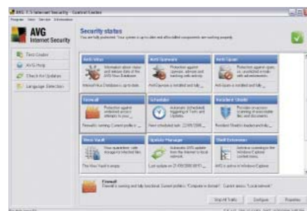
Centro de Controle do AVG Internet Security

A Grisoft oferece uma versão de avaliação totalmente funcional de todos os produtos AVG. Por um período de 30 dias, você poderá testar gratuitamente o desempenho do AVG com serviço de suporte técnico.