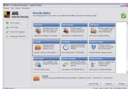
Centro de Controle do AVG Internet Security Network Edition

A Grisoft oferece uma versão de avaliação totalmente funcional de todos os produtos AVG. Por um período de 30 dias, você poderá testar gratuitamente o desempenho do AVG com serviço de suporte técnico.